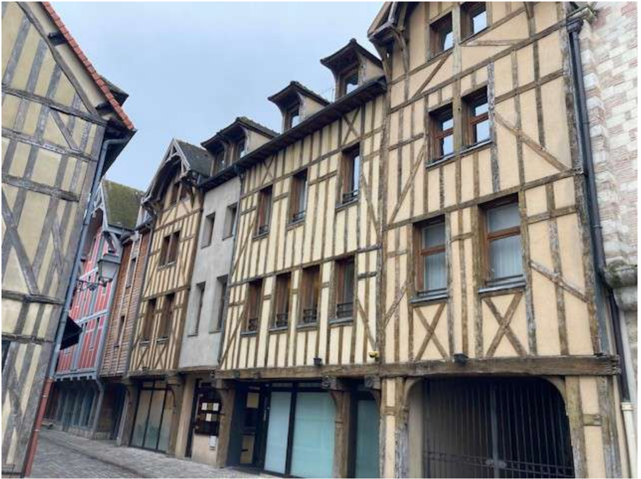
Vue de la façade rue Paillot de Montabert